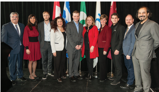
Lancement de la Chaire UNESCO-PREV