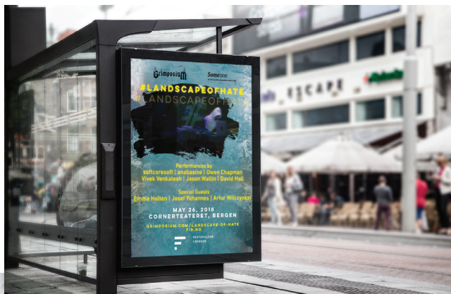
Landscape of Hate au Festival international de Bergen / Bergen International Festival