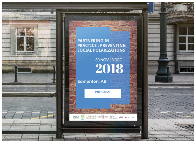
Partenariat dans la pratique : Prévenir les polarisations sociales. Crédits : CPN-PREV