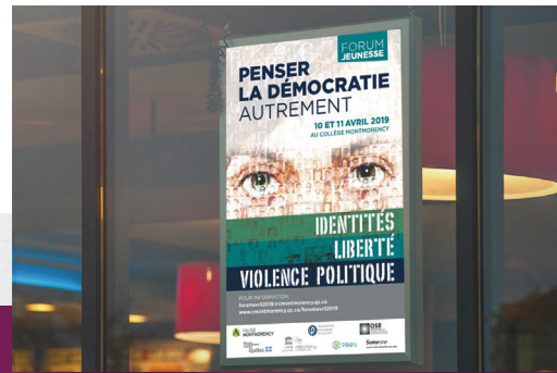
Forum Penser la démocratie autrement