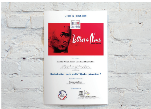
Conférence Radicalisation : quels profils ? Quelles préventions ? à Paris, France