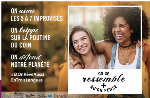
Campagne de sensibilisation On se ressemble + qu'on pense