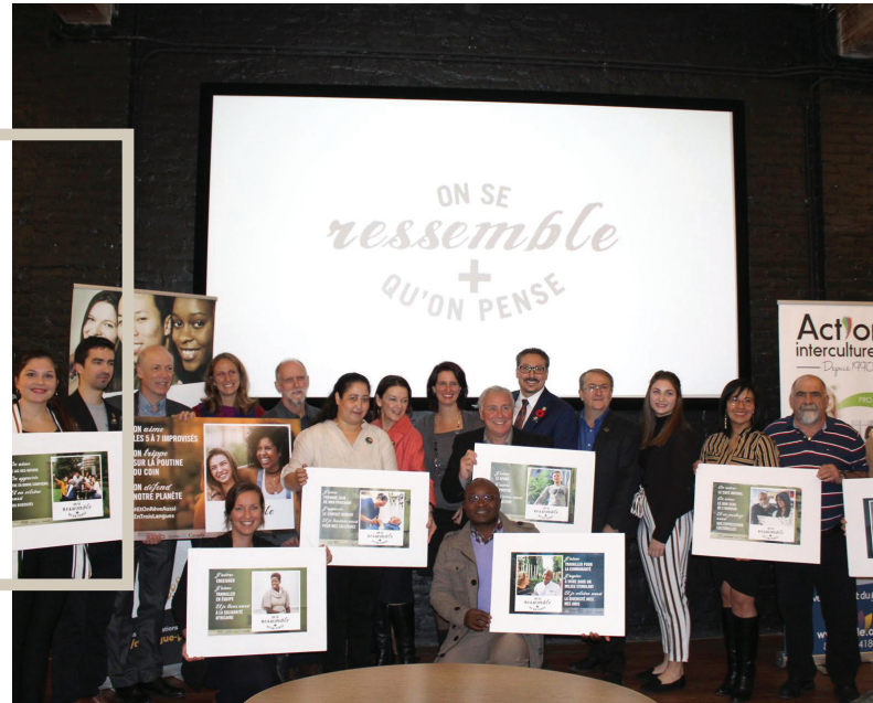
Campagne de sensibilisation On se ressemble + qu'on pense .

Le quatrième objectif de la Chaire est d'assurer la sensibilisation, la visibilité et le transfert des connaissances auprès du public et des médias. En 2018, la Chaire UNESCO-PREV a organisé quatre événements d'envergure nationale et internationale, pris part à quatre projets en prévention sur le terrain, produit près d'une vingtaine de vidéos, podcasts ou webinaires, participé à une quarantaine de conférences, contribué à une quinzaine de publications et autant d'apparitions dans les médias.